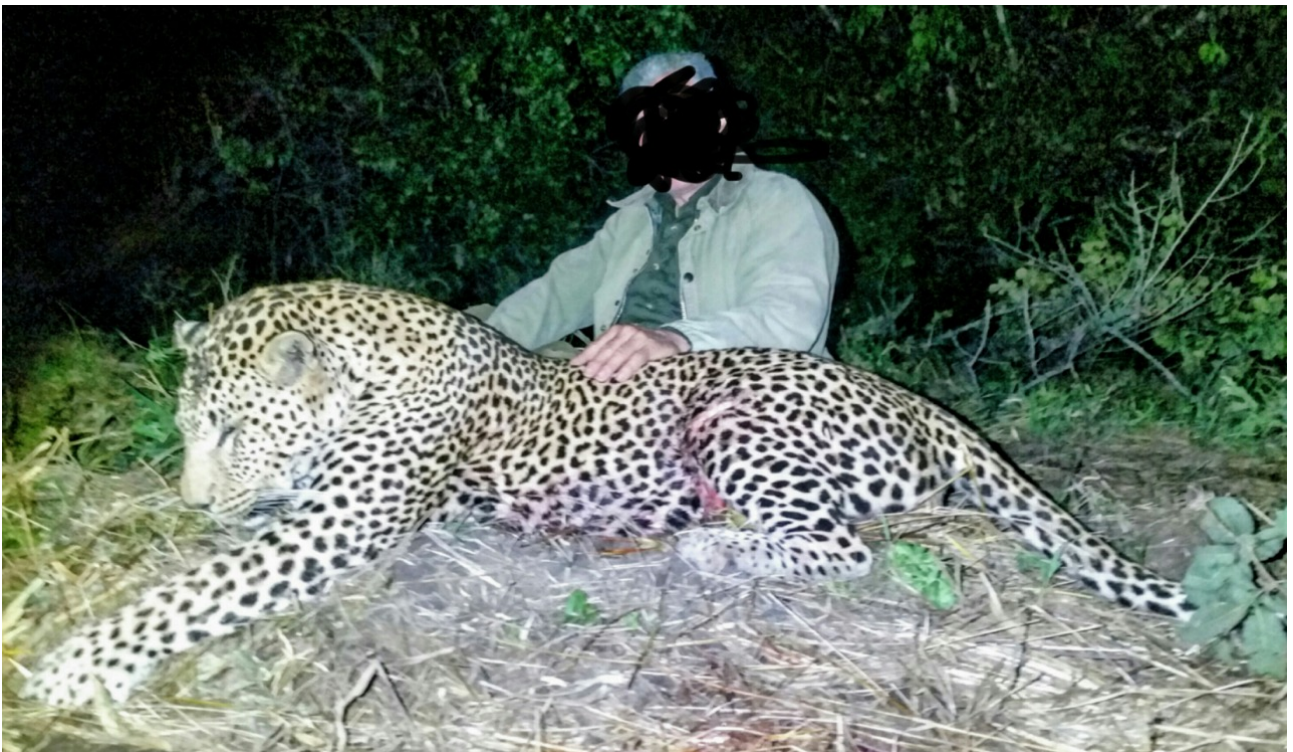
In Matetsi erlegter Leopard.

Weil unsere Safaris in Matetsi und Chiredzi ganz individuell sind, haben wir keine Standard-Programme, sondern wir bitten Sie, uns Ihre Wünsche zu schildern für eine Safari genau nach Ihren Angaben.