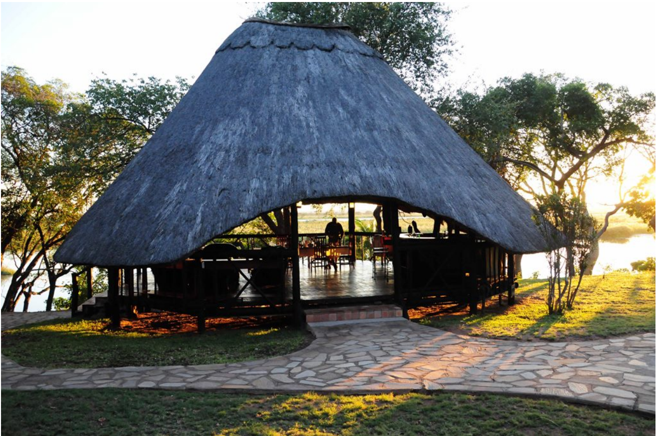
Diningroom im Camp Matetsi Unit 6