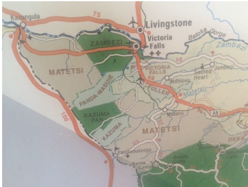
Matetsi liegt nicht weit vom Flughafen Victoria Falls, es ist ein kurzer Transfer.