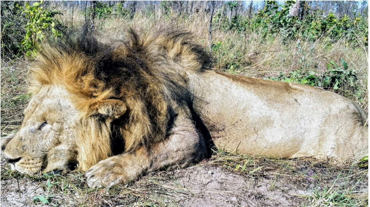
In Matetsi erlegter Mähnenlöwe