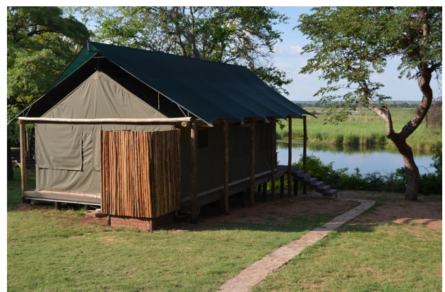
Dies kann Ihre Unterkunft in Matetsi Unit 6 sein