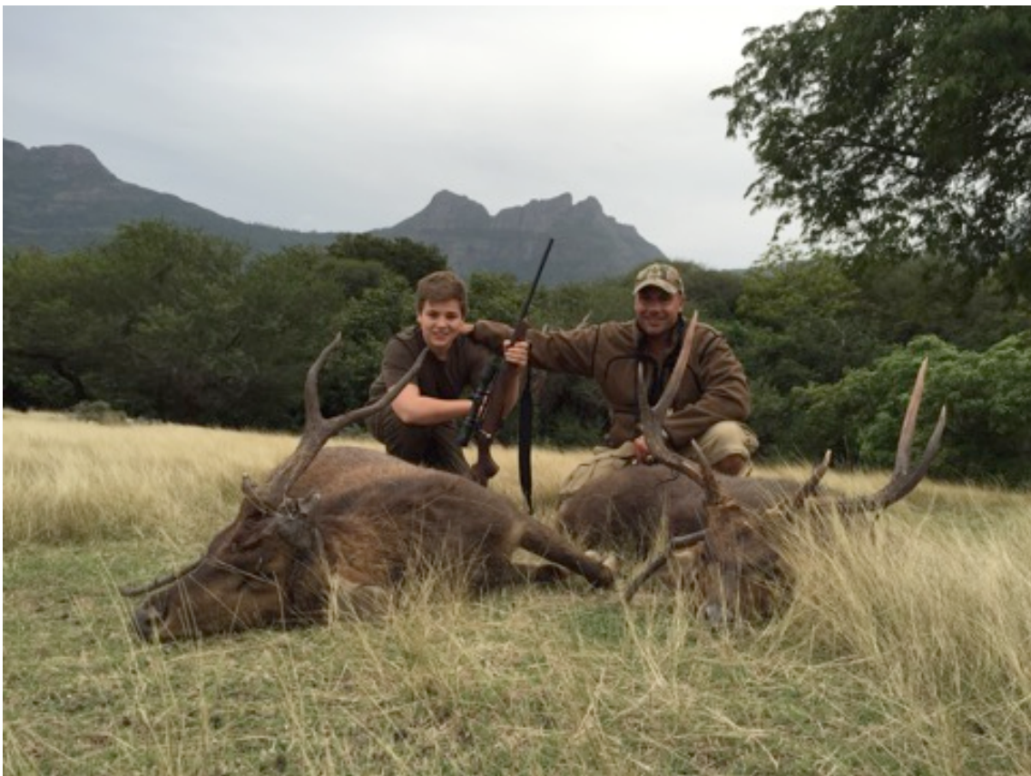
Wenn der Vater mit dem Sohne