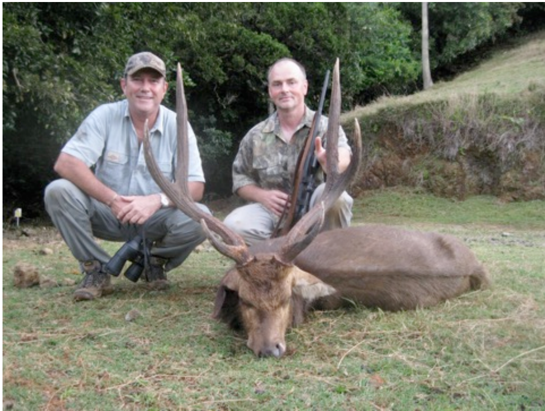
Links unser Jagdorganisator