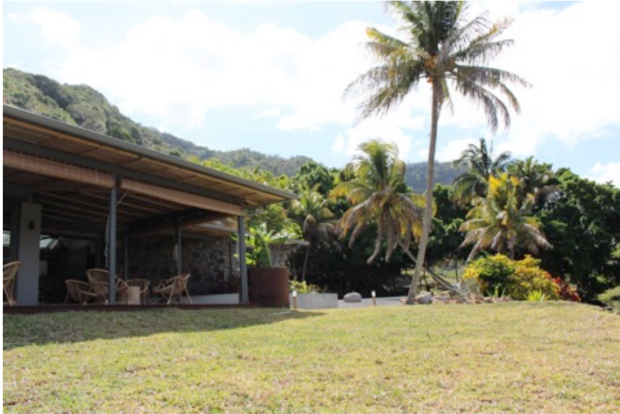
Die überdachte Terrasse