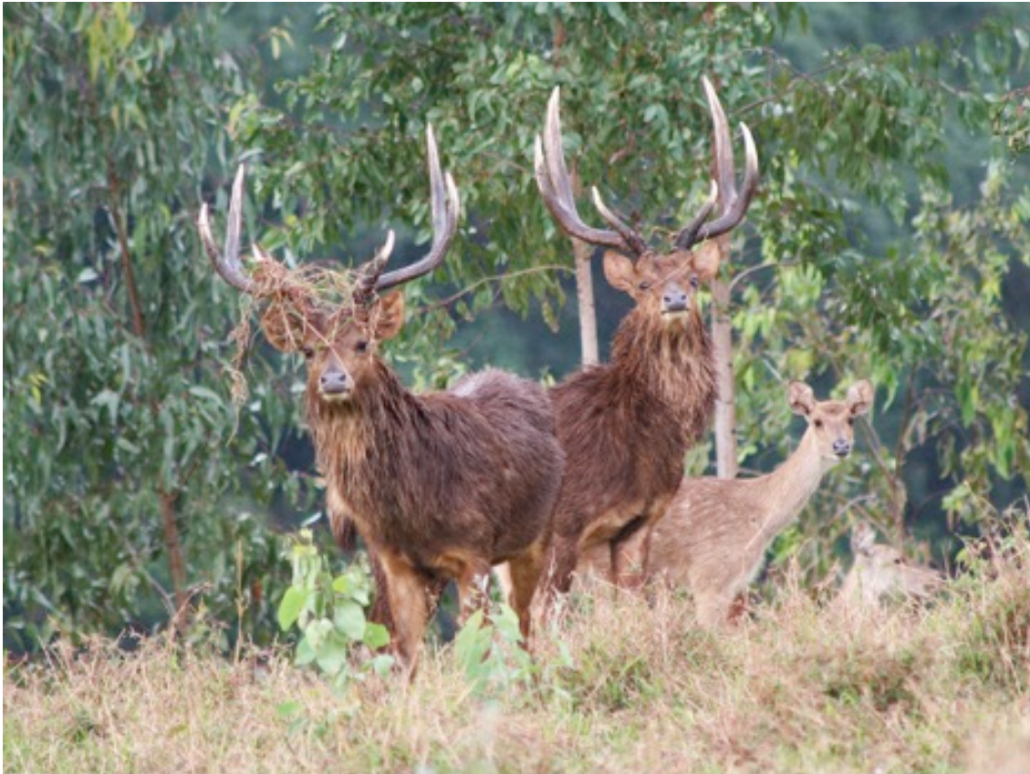
Rusas sind in der Brunft in jeder Hinsicht äußerst aktiv