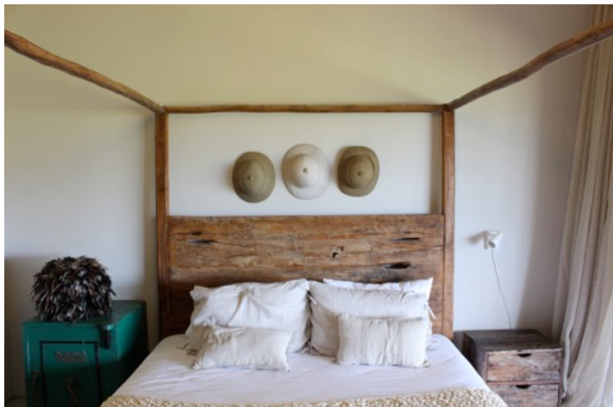
Es gibt 2 Schlafzimmer für 4 Personen